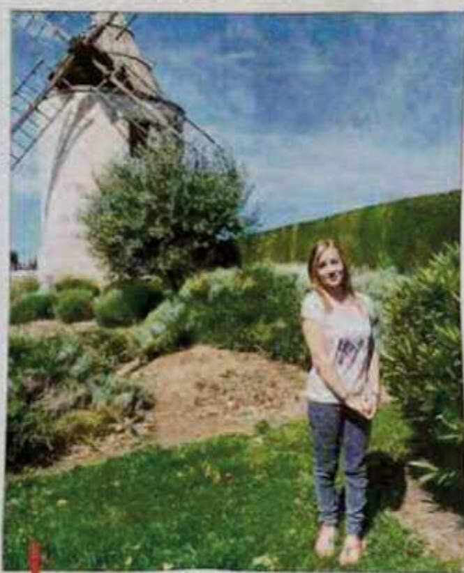
La Plan-de-Cuquoise de 13 ans a reçu un "Award" à Los Angeles pour sa participation en 2013 dans le court "On a Wire".

Des pubs aux côtés de Zidane, un film avec Moussa Maaskri... et une vie de collégienne.